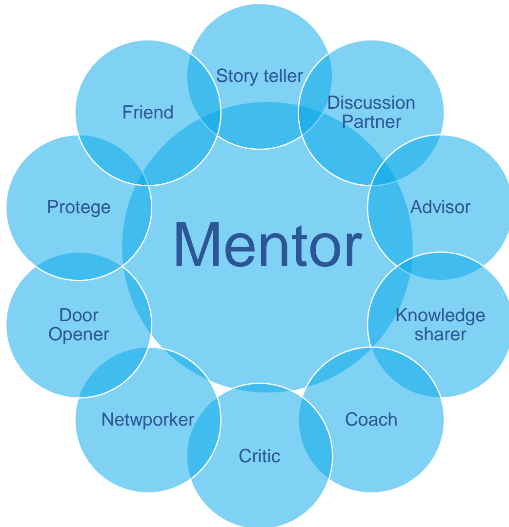
Mentor's 10 situational roles by K.M.Poulsen